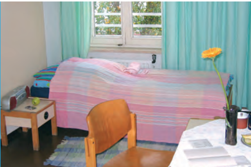
Eigene vier Wände